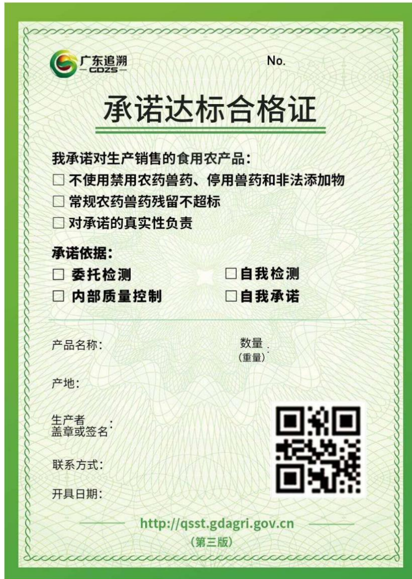
图 G.1 广东省承诺达标合格证样式 1