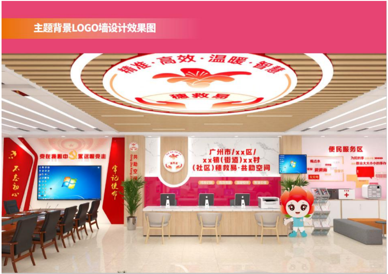
图 A.8 “穗救易·共助空间”主题背景 LOGO 墙设计效果图