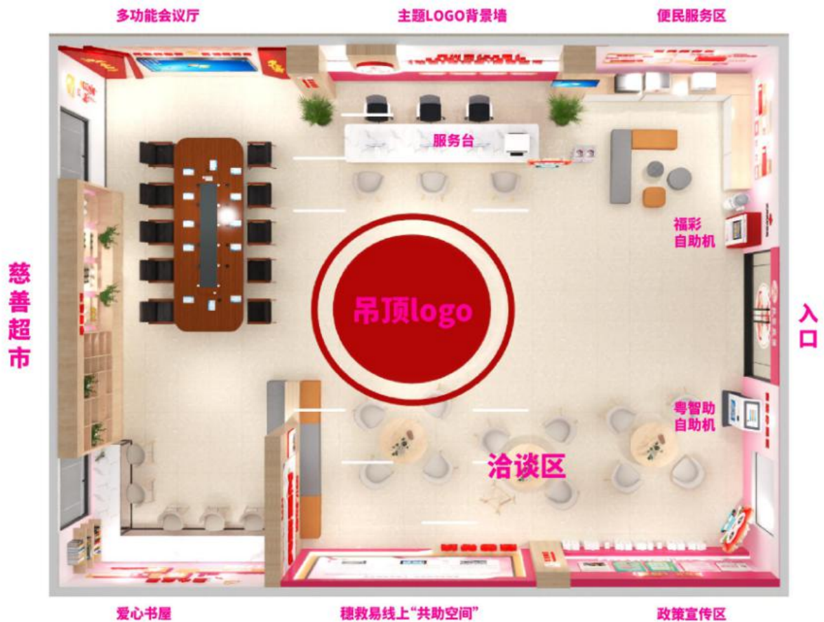
图 A.2 “穗救易·共助空间”平面布局规划图