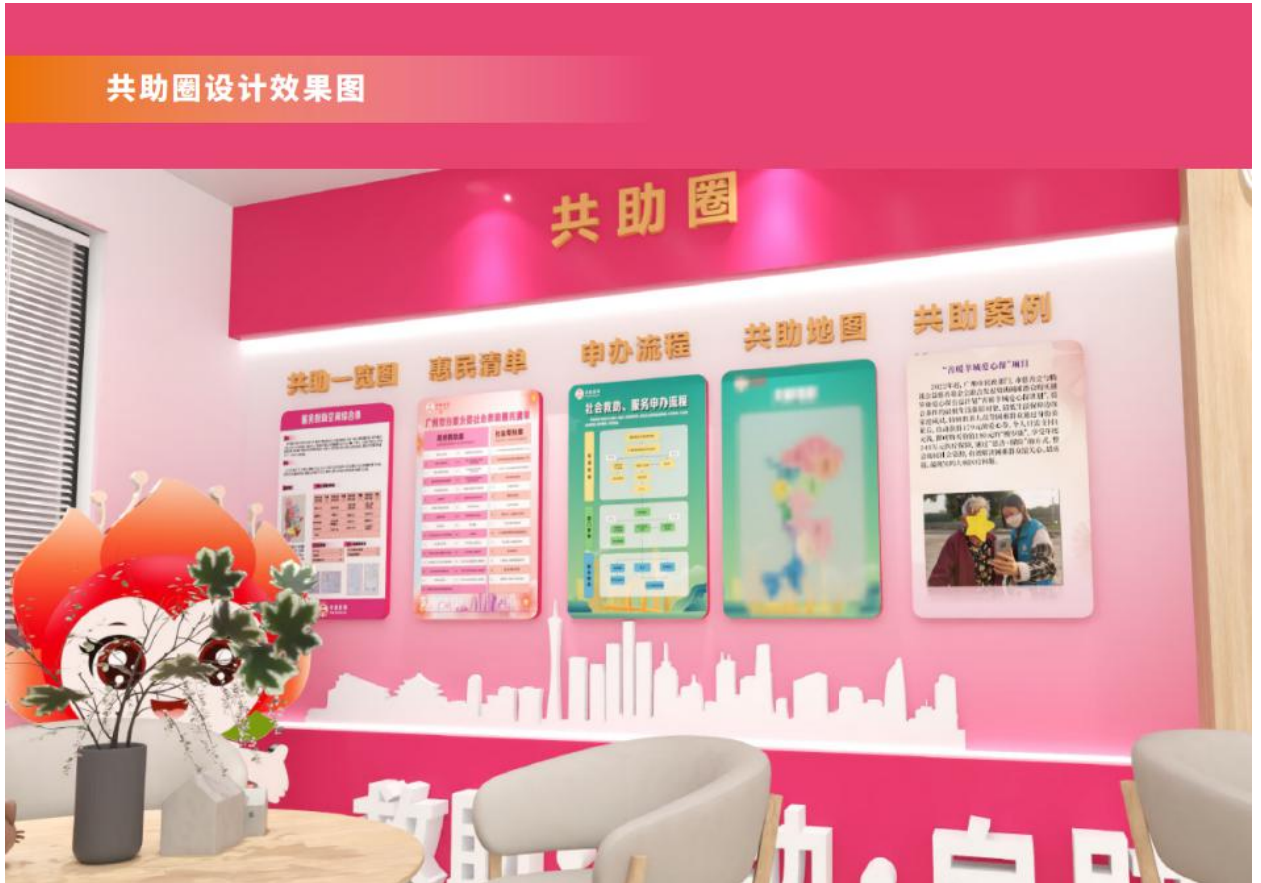
图 A.7 “穗救易·共助空间”共助圈设计效果图