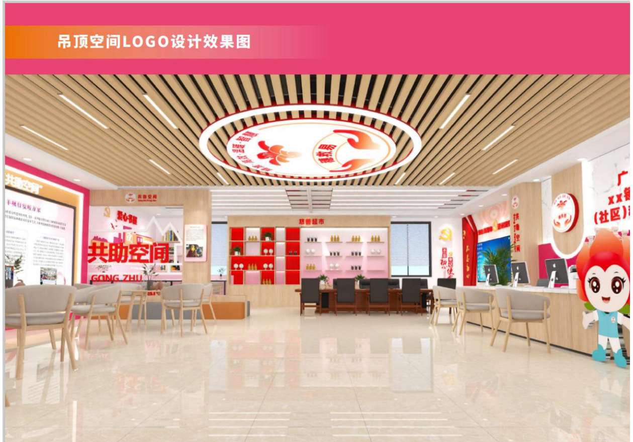
图 A.4 “穗救易·共助空间”吊顶空间 LOGO 设计效果图