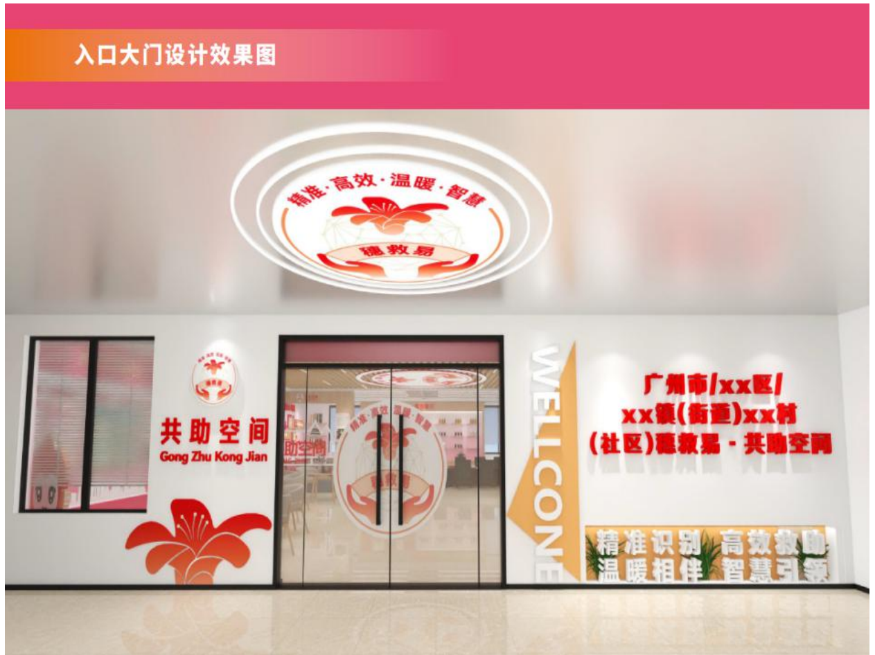
图 A.3 “穗救易·共助空间”入口大门设计效果图