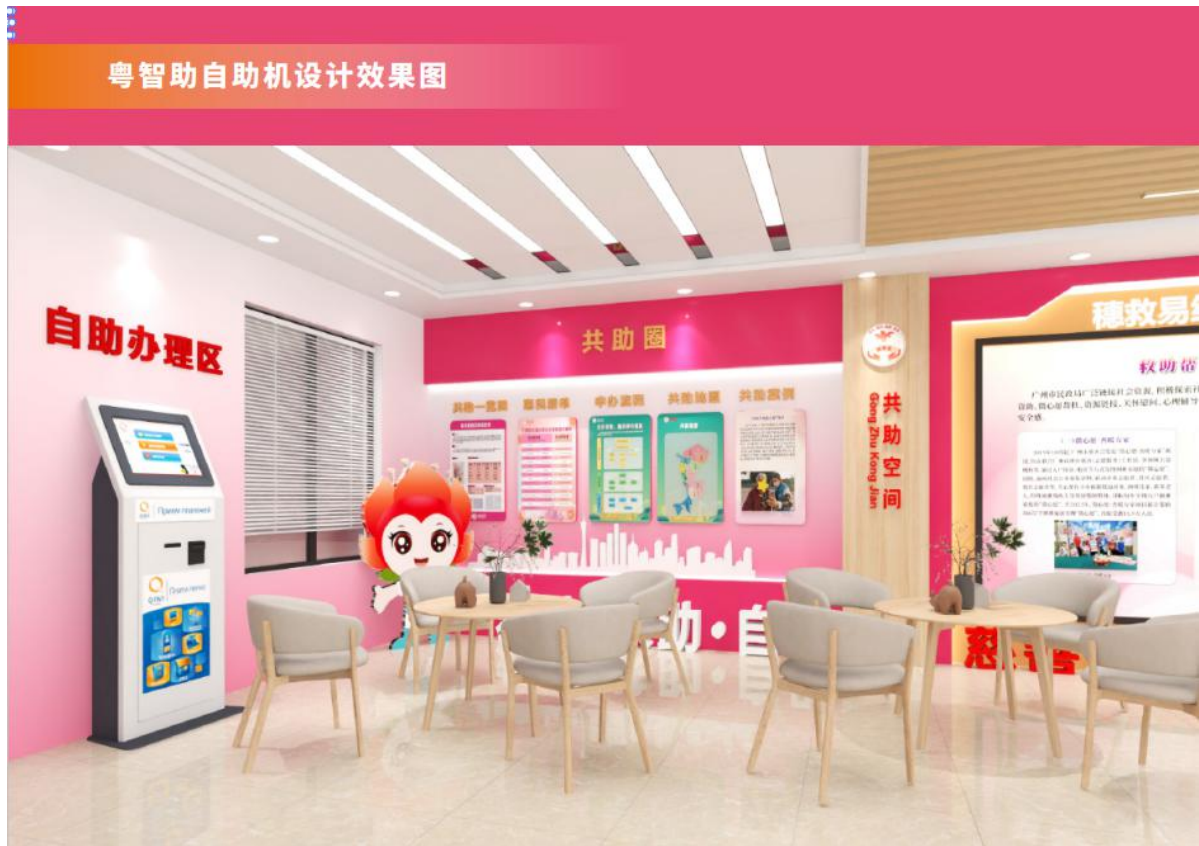
图 A.6 “穗救易·共助空间”政府服务自助机设计效果图