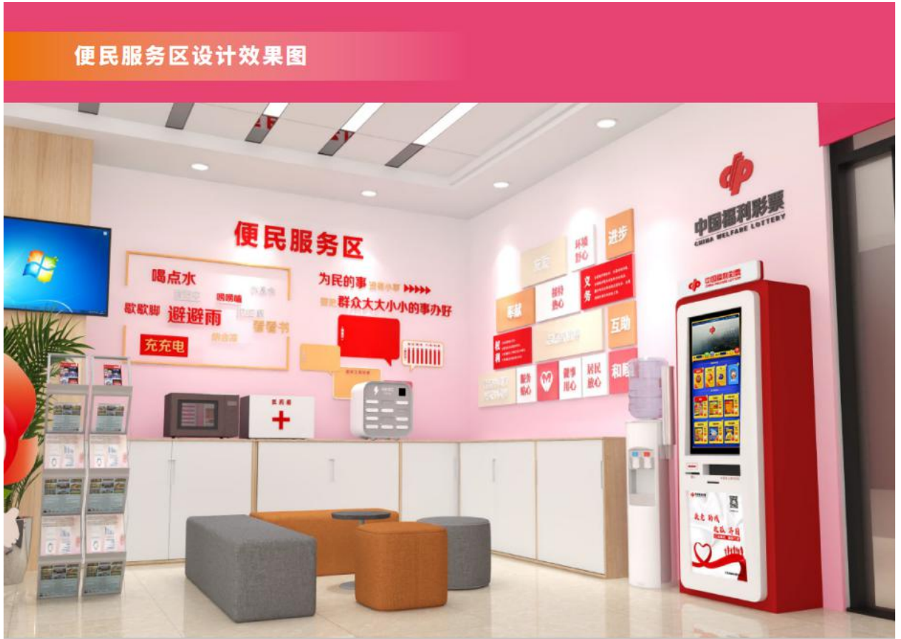
图 A.5 “穗救易·共助空间”便民服务区设计效果图