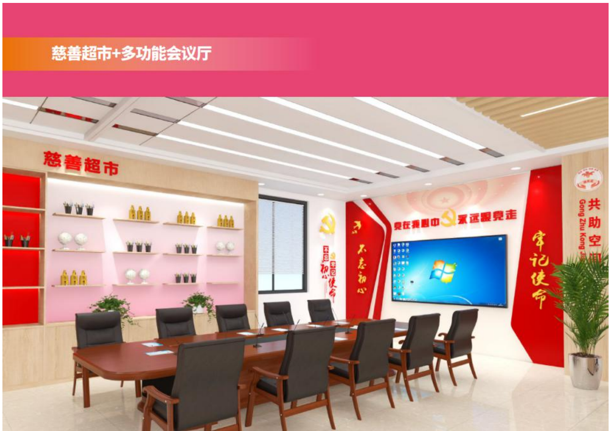
图 A.10 “穗救易·共助空间”慈善超市+多功能会议厅